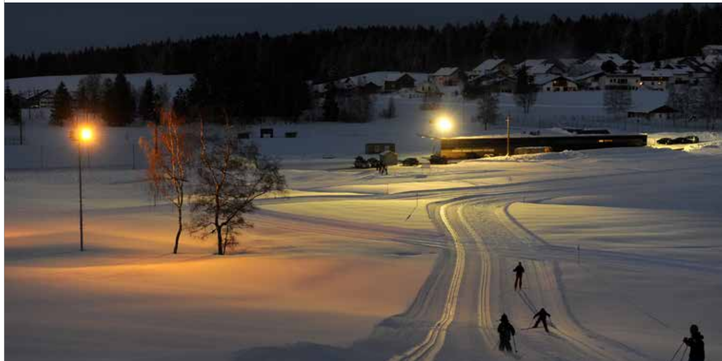
In der Langlauf-Arena Sulzberg steht eine Beschneiungsanlage und Flutlicht zur Verfügung.